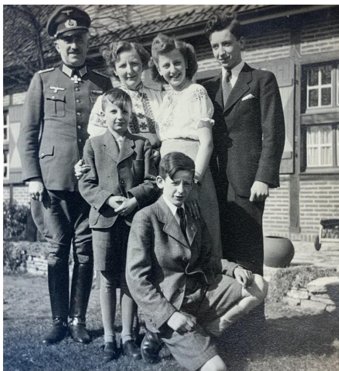
Familie Pünder (1942)

In einer Randlage Münsters erwarb mein Vater ein kleines landwirtschaftliches Anwesen, das er nach und nach zu einem Nebenerwerbsbetrieb zu entwickeln trachtete. Als dann im September 1939 der Krieg ausbrach, wurde er als Reserveoffizier des Ersten Weltkrieges wie alle mittleren Altersjahrgänge zum Militärdienst einberufen. Als Hauptmann, später Major war er in einer nachgeordneten Funktion in einer Stabsstelle des deutschen Ersatzheeres in Münster beschäftigt.