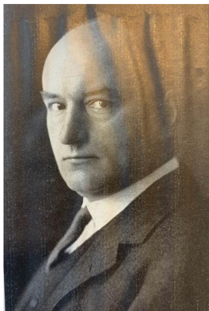
Erich Klausener, ermordet am 30. Juni 1934 auf Befehl von Hermann Göring

Zu den ersten Opfern des nationalsozialistischen Staatsterrors gehörte mein Onkel Dr. Erich Klausener, ein Vetter meiner Mutter. (Meine Großmutter und Klauseners Mutter waren Schwestern).